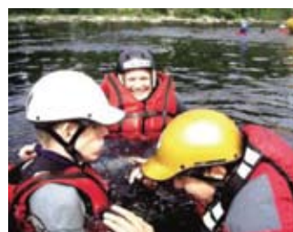
En el agua