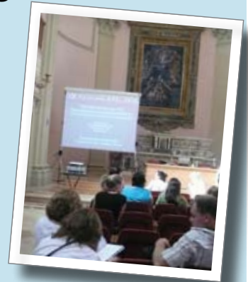
Taller en Chiesa dei Concelli