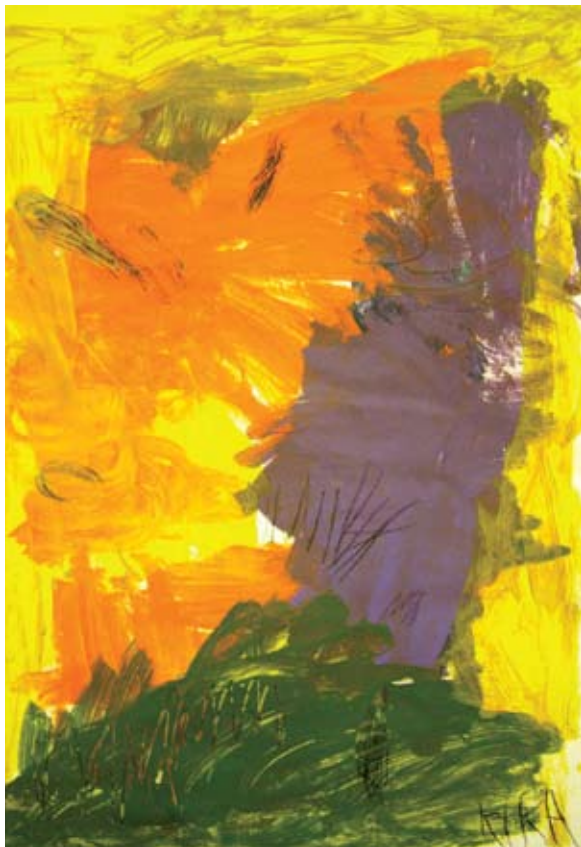
Armonía de colores

años los inicios de Maják no fueron fáciles. El problema era en parte que el personal era muy joven; antes de la apertura de la casa grupal, el personal recibió formación para trabajar con personas sordociegas, pero no tenían ninguna experiencia práctica y tenían dificultades para resolver situaciones complicadas con los residentes. Algunos de ellos querían irse tras el primer mes, ya que pensaban que no podrían tener éxito. Trabajamos mucho para solucionar esto.