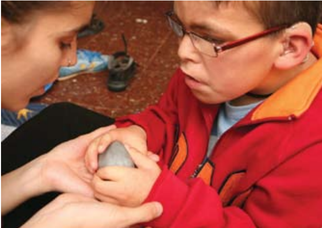
Merch y Enrica