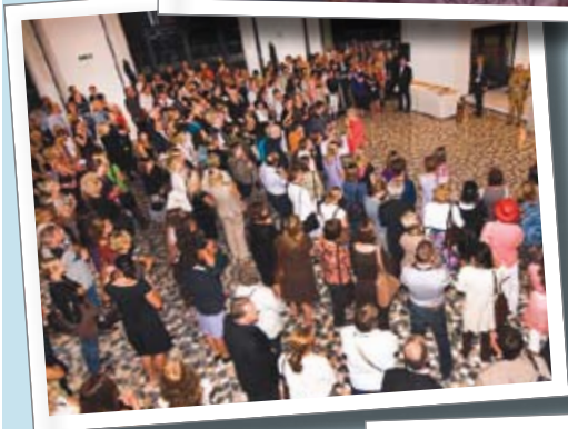
Bienvenida a Senigallia