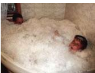
Baño y Burbujas

Marte lo preparó todo con mucho cuidado; ¡muchas gracias a todos los que lo hicieron posible!