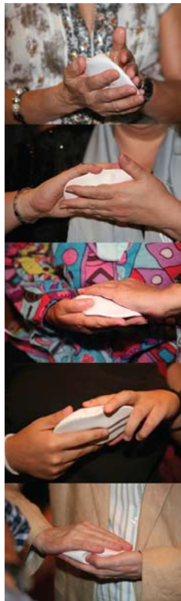
Experimentando La forma