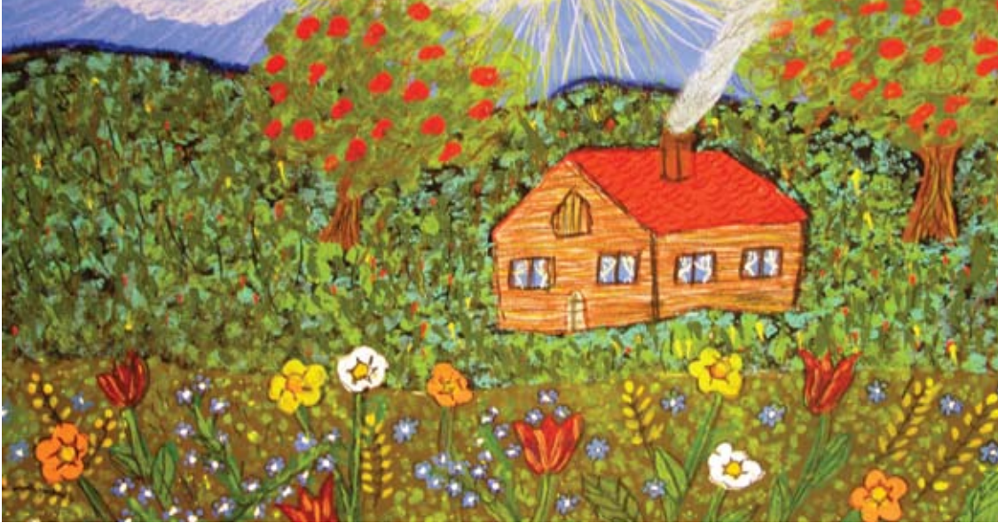
Juraj dibuja siempre una casa pequeña o una chica en casi todo lo que pinta