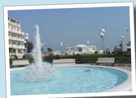
Frente al mar