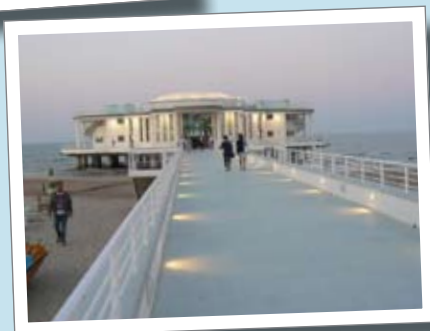
Rotonda a mare