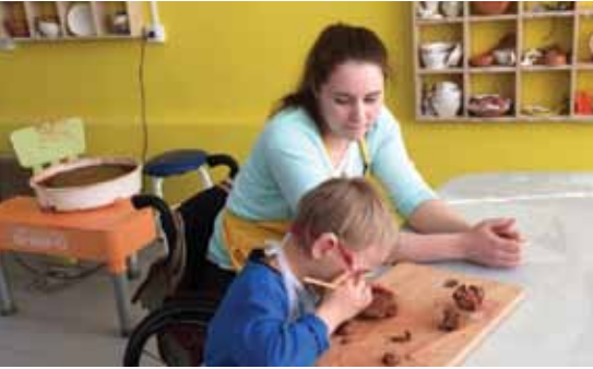
Clase de cerámica con un niño sordociego en el Centro de Recursos ruso “Yaseneva Poliana”

de la DbI Review, también estamos pensando en hacer que cada vez más material de la DbI esté disponible para todos los profesionales de Rusia. Por esta razón, estamos haciendo un gran esfuerzo en traducir cada una de las ediciones de la DbI Review al ruso, y lo denominamos DbI Review Rusia. Una característica especial de la versión rusa es que incluimos materiales de autores nacionales