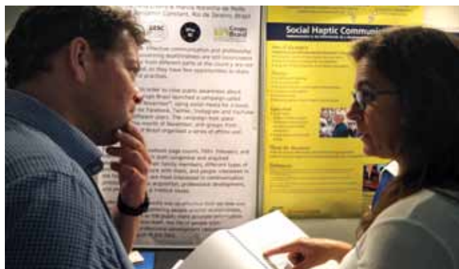
Sesión de póster