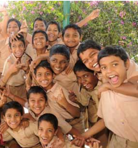
Estudiantes en una escuela inclusiva en la India