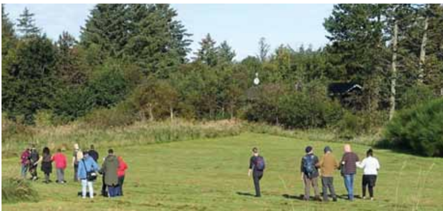
Paseo por el bosque

Visitad la DbI Outdoor Network (Red de Actividades al Aire Libre de la DbI) en YouTube https://www.youtube.com/watch?v=IJKakhh3SeM