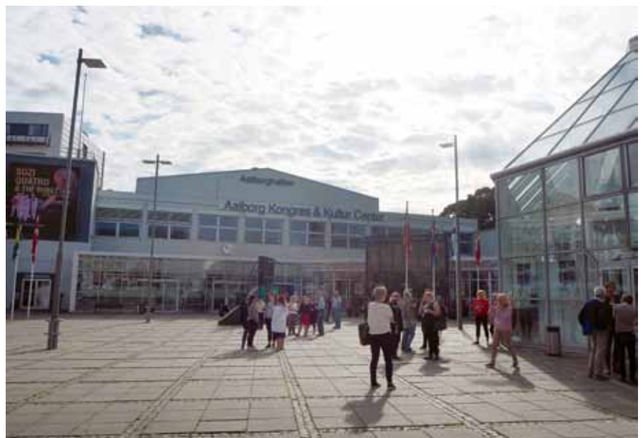
Centro de Conferencias