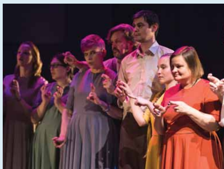
“En Contacto”, en el Teatro Nacional