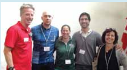
Grupo de la red en Aalborg

Las personas interesadas en hacerse miembros de la Red deben enviar una “carta de presentación” a cada uno de los co-presidentes, después de lo cual serán añadidos al grupo de Facebook ‘Deafblindness & APA’. Dichas cartas de presentación individuales serán publicadas para que todos puedan conocer quién se ha incorporado al grupo.